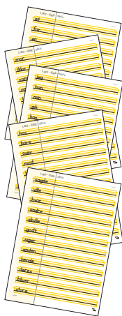
Liste 1, 2, 3, 4 og 5